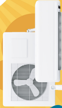
分離式冷氣機以外機台數認定