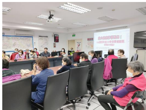
方案名稱 6：參與式預算住民社福大會