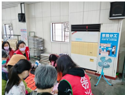
方案名稱 5：志工教育訓練