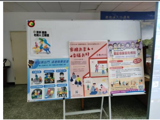
方案名稱 11：獨老志工服務教育訓練