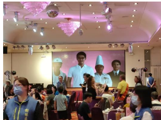
方案名稱 13：紅麴料理親子趣