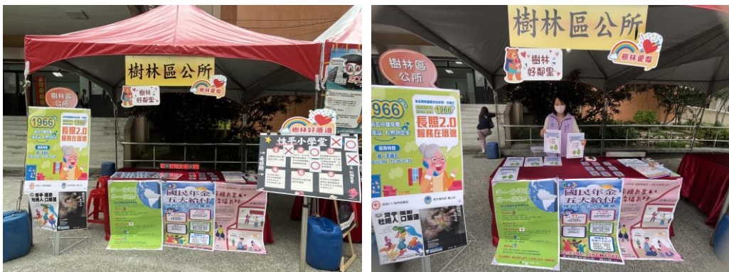
方案名稱 10：兒童夏令營報名活動